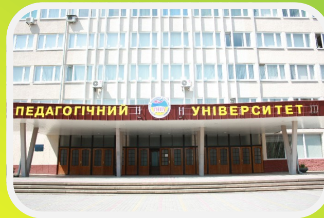
Тернопільський національний педагогічний університет імені В.Гнатюка

вул. Максима Кривоноса, 2, Тернопіль, Україна, 46000