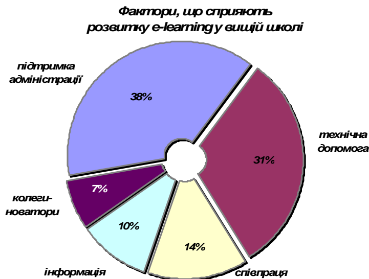
Рис. 2. Фактори, що сприяють просуванню e-learning у вищій школі (за результатами опитування)

Серед факторів, що сприяють просуванню e-learning у вищій школі, нашими респондентами названі (рис. 2): інформація (21%), співпраця (28%), колеги-новатори (10%). Проте найбільший відсоток набрали фактори, які можемо вважати знаковими для нашого університету, а саме — методична і технічна допомога (34 відсотки) та підтримка адміністрації (38 відсотків). Поштовхом до стрімкого розвитку електронного навчання в університеті став тренінг «Методика створення електронного курсу у системі MOODLE», проведений для співробітників ТНПУ викладачами кафедри інформатики і методики її викладання.