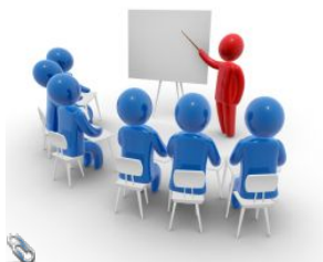
Презентація до уроку