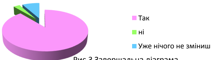
Рис.3 Завершальна діаграма

Отже, на думку опитаних нами респондентів, запропоновані нами заходи здатні змінити оздоровчо-екологічні напрямки розвитку стратегії Тернополя на краще.