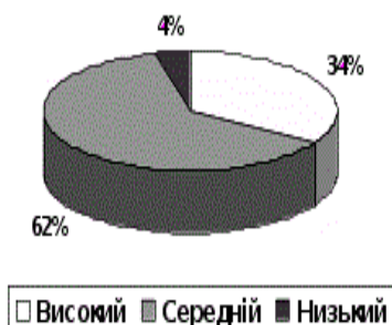
Рис. 2. Рівень екологічної вихованості дошкільнят після проведення формувального експерименту