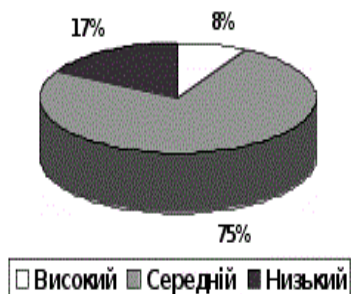
Рис. 1. Рівень екологічної вихованості дошкільнят до проведення формувального експерименту

З цією метою доцільним є залучення студентів до роботи з дітьми у ДНЗ. Особливо студентів факультетів географічних напрямків.