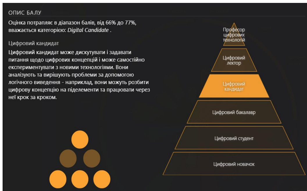
Рис. 2. Опис рівня досягнення окремої складової цифрової компетенції

Окрім цього користувач може отримати 3 рекомендовані області, що підсилюють цифрові компетентності згідно обраного профілю. При цьому буде доступно 50 різних аспектів цифрової компетентності, які можна розвинути за допомогою майже 200 вправ та мотиваційних прикладів. Важливим підходом для аналізу підсумкової оцінки є застосування бенчмаркінгу компетентностей: розміщення набутих якостей у діапазоні середніх оцінок. Ті компетентності, які вищі нормального розподілу, свідчать про високий рівень набуття і, навпаки, – ті, що нижче середніх, потребують удосконалення.